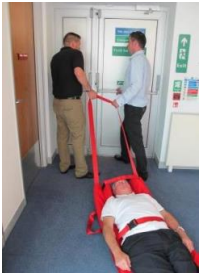
16. Ziehen Sie die Evacuslider Matratze auf ebener Fläche mit 2 Personen am Kopfende bis zum Sammelpunkt.