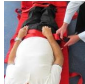
7. Passen Sie die Gurte in der Länge an und schließen Sie Fuß- und Hüftgurte.