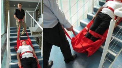
14. Jetzt wechselt das Gewicht zur Person am Kopfende und am Fuß der Treppe wieder zur Person am Fußende.