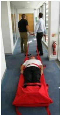
9. Die Matratze kann nun von mindestens 2 Personen mit Hilfe der Gurte am Kopfende einfach gezogen werden.