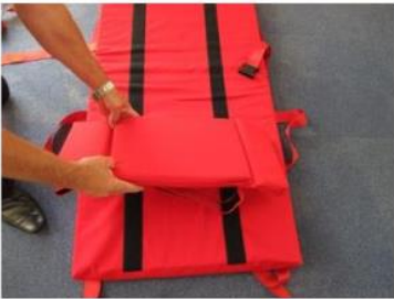
6. Bei den Modellen Evacuslider Premium und Premium Plus muss die Kopfstütze und der Fußsack auf die Größe der Person abgestimmt werden.