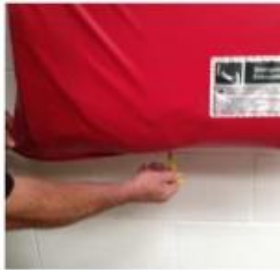
2. Öffnen Sie den Reißverschluss an der Unterseite.