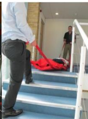
10. Die zu rettende Person wird mit den Füßen voran an der Treppe positioniert. Die Person auf der Treppe geht in einen sicheren Stand und die Person am Kopfende übernimmt das Kommando.