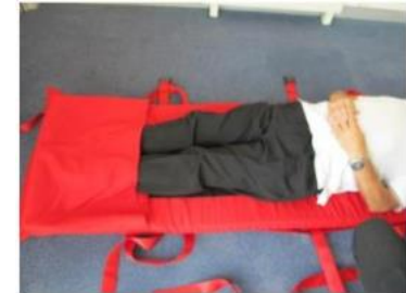
5. Positionieren Sie die zu rettende Person mit den Füßen im Fußsack auf der Matratze.