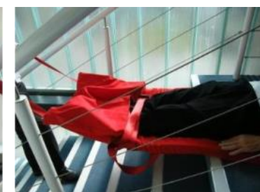
12. Nach Kommando ziehen Sie die Matratze und achten darauf, dass der Rücken der zu rettenden Person gerade bleibt.