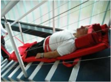
13. Ist die Evacuslider Matratze der Länge nach auf der Treppe, lassen Sie die Matratze langsam runter.