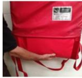
3. Die Evacuslider Matratze sollte nun leicht entnehmbar sein.