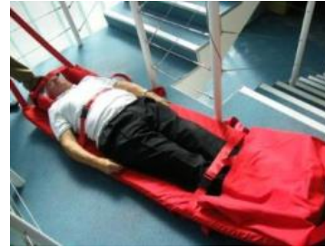
15. Manövrieren Sie um den Treppenabsatz und nehmen Sie den nächsten Treppenabschnitt in Angriff.