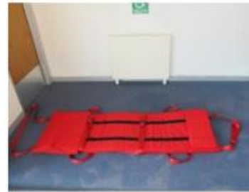
4. Entfalten Sie die Matratze und öffnen Sie die Schnellverschlüsse.