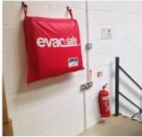
1. Die Evacuslider Matratze sollte idealerweise in Schulterhöhe und frei zugänglich an der Wand hängen